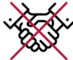
Hand geben Nein, Wertschätzung ja