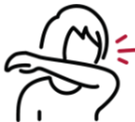
in den Ellenbogen nießen